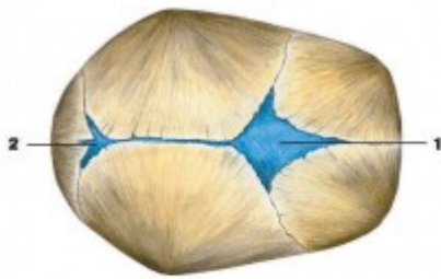
Череп новорожденного б — вид сверху: 1 — большой родничок; 2 — малый родничок; 3 — клиновидный родничок; 4 — сосцевидный родничок

розділ: Дитяча неврологія, дата: 14.02.2021, автор: Одінцова О.Ю. дитячий невролог.